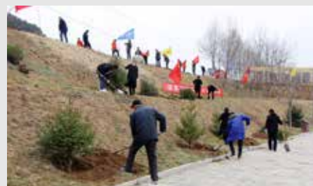
3月12日，玉华宫景区开展“建设秀美景区 推进绿色发展”义务植树活动。