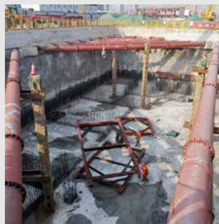
3月5日，盾实公司有序进行地铁人防项目施工。