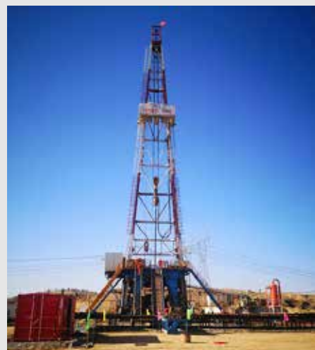
3月17日，一九四公司致密砂岩气项目顺利开钻。